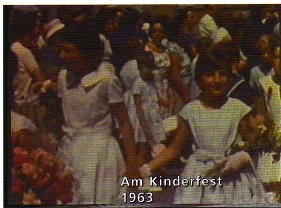
Am Kinderfest 1963